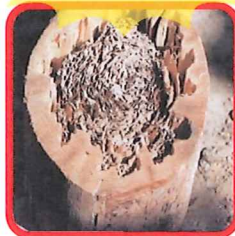
▲シロアリによる柱の被害